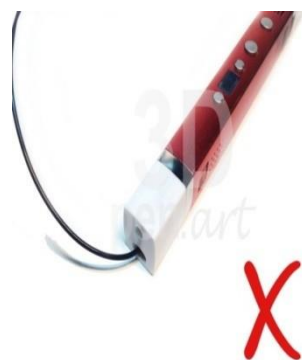
Пластик в 3D ручке

Модель 3D ручек Myriwell RP100C — выбор мастеров проекта 3DPen.art . Она имеет очень полезную функцию. Если вы не рисовали включенной ручкой более двух минут, включается режим «Sleep», или, проще говоря, ручка уходит в спящий режим и остывает. Однако, даже с такой функцией, по завершении работы обязательно отключайте прибор от сети, предварительно вытащив весь пластик из 3D ручкой.