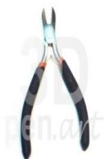
Бокорезы для 3D ручки

Для того, чтобы отрезать вышеуказанные хвостики или обрезать лишнее на поделке, чаще всего используют бокорезы.