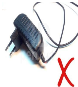
Поврежденный блок питания для 3D ручки

При работе с любым нагревательным или электрическим просто необходимо соблюдать технику безопасности. От соблюдения всех норм зависит как сохранность оборудования, так и твое личное здоровье. 3D ручка не является исключением, так как это электрический прибор с нагревающимся элементом. В этой статье мы разберем все меры предосторожности при работе с 3D ручкой