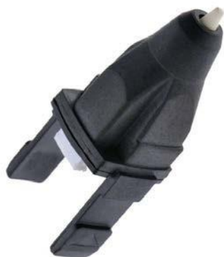
Сопло 3D ручки

Они предназначены только для пластика. Не стоит с помощью бокорезов снимать пластик с сопла 3D ручки. Одно неосторожное движение, и носик можно срезать.